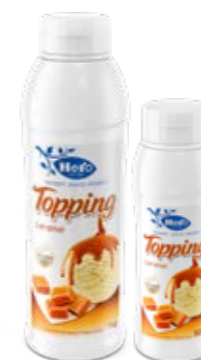
Caramel Bouteille de 1kg N° d'art. 2414.705 6 bouteilles de 500g N° d'art. 2414.700