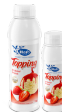
Fraise Bouteille de 1kg N° d'art. 2415.705 6 bouteilles de 500g N° d'art. 2415.700