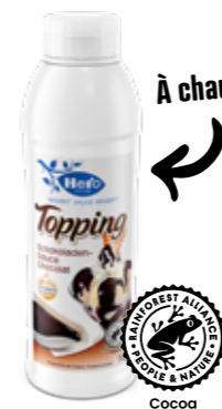
Sauce au chocolat Bouteille de 1kg N° d'art. 2418.705