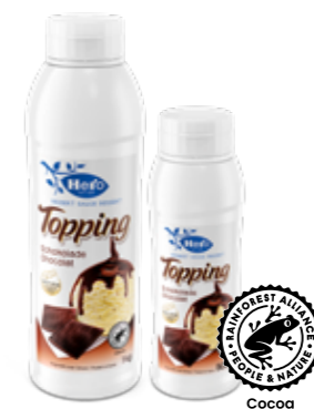
Chocolat Bouteille de 1kg N° d'art. 2413.705 6 bouteilles de 500g N° d'art. 2413.700