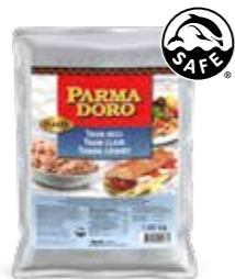
Parmadoro Thon Flakes Yellowfin Öl/Bouillon