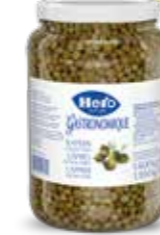
Kapern extra fein 6 Gläser à 1,6 kg Art.-Nr. 2799.231