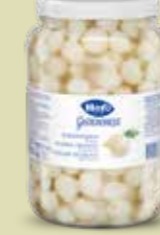
Silberzwiebeln 6 Gläser à 1,5 kg Art.-Nr. 4147.231