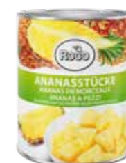
Ananasstücke 6 Dosen à 3,06 kg Art.-Nr. 6244.110