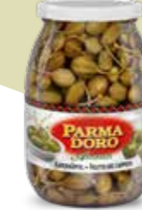
Parmadoro Kapernäpfel 6 Gläser à 1 kg Art.-Nr. 2880.239