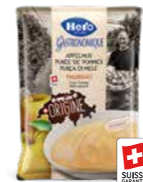
Origine Apfelmus ohne Zuckerzusatz 2 Beutel à 2,5kg Art.-Nr. 2664.340