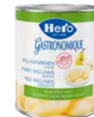
Williamsbirnen halbe im eigenen Saft 6 Dosen à 3kg Art.-Nr. 2332.110