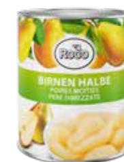
Birnen halbe 6 Dosen à 3,11 kg Art.-Nr. 6243.110