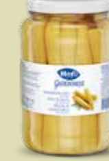
Maiskölbchen 6 Gläser à 1,55 kg Art.-Nr. 4146.231