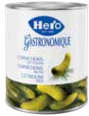
Cornichons 6 Dosen à 2,9 kg Art.-Nr. 2838.110