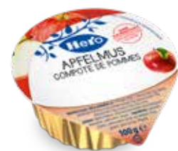
Apfelmus 120 Becher à 100g Art.-Nr. 2351.140