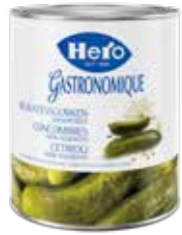
Delikatessgurken unsortiert 6 Dosen à 2,75 kg Art.-Nr. 2867.110