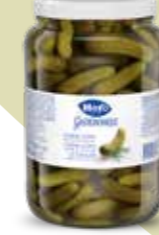
Cornichons 6 Gläser à 1,55 kg Art.-Nr. 4148.231