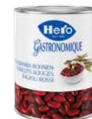
Rote Indianerbohnen 6 Dosen à 3,1kg Art.-Nr. 2905.110