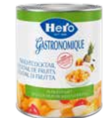
Fruchtcocktail in Fruchtsaft 6 Dosen à 3kg Art.-Nr. 2328.110