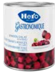
Randen in Würfeln