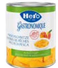
Pfirsichschnitze in Fruchtsaft 6 Dosen à 3kg Art.-Nr. 2327.110