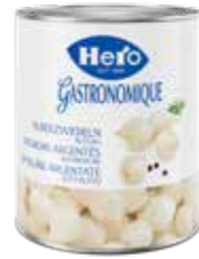
Silberzwiebeln in Essig 6 Dosen à 2,85 kg Art.-Nr. 2841.110