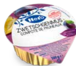
Zwetschggenmus 120 Becher à 100g Art.-Nr. 2350.140