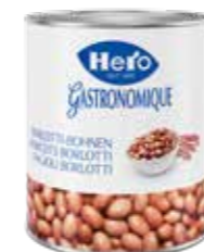
Borlotti Bohnen 3 Dosen à 3,1kg Art.-Nr. 2701.110