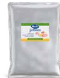
Apfelmus ohne Zuckerzusatz 4 Beutel à 3kg Art.-Nr. 2334.344