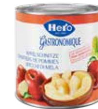
Apfelschnitze ohne Zuckerzusatz 6 Dosen à 2,6kg Art.-Nr. 2851.131