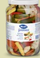
Mixed pickles 6 Gläser à 1,55 kg Art.-Nr. 4149.231