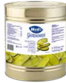
Delikatessgurken Längsschnitt 1 Dose à 9,7 kg Art.-Nr. 4145.106