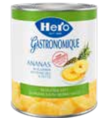
Ananas in Scheiben im eigenen Saft 6 Dosen à 3kg Art.-Nr. 2331.110