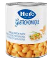
Sojabohnen 6 Dosen à 3,1kg Art.-Nr. 2903.110