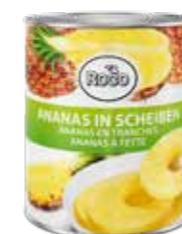
Ananas in Scheiben 6 Dosen à 3,06 kg Art.-Nr. 6245.110