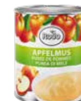
Apfelmus 6 Dosen à 820 g Art.-Nr. 6242.101