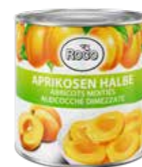
Aprikosen halbe 6 Dosen à 2,65 kg Art.-Nr. 6239.131