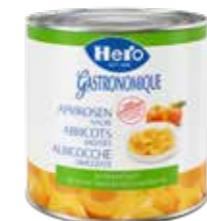
Aprikosen halbe in Fruchtsaft 6 Dosen à 2,6kg Art.-Nr. 2399.131