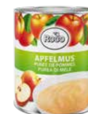
Apfelmus 6 Dosen à 3,21 kg Art.-Nr. 6242.110