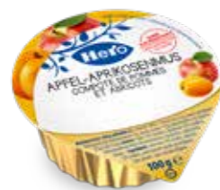
Apfel-Aprikosenmus 120 Becher à 100g Art.-Nr. 2353.140