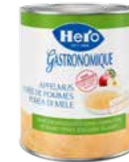
Apfelmus ohne Zuckerzusatz 6 Dosen à 3,1kg Art.-Nr. 2319.110