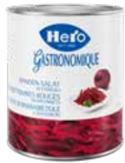
Randen in Stängeli