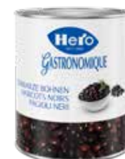
Schwarze Bohnen 3 Dosen à 3,1kg Art.-Nr. 2730.110