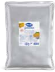
Golden Sweet Corn