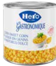
Golden Sweet Corn