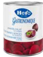
Randen in Scheiben