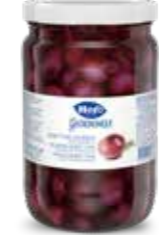
Borettane Zwiebeln in Rotweinessig 6 Gläser à 1,65 kg Art.-Nr. 2784.231