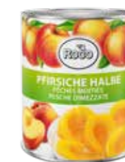
Pfirsiche halbe 6 Dosen à 3,11 kg Art.-Nr. 6240.110