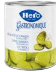
Delikatessgurken Querschnitt 6 Dosen à 2,85 kg Art.-Nr. 2858.110