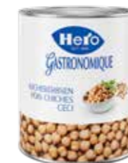
Kichererbsen 6 Dosen à 3,1kg Art.-Nr. 2659.110