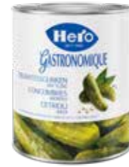
Delikatessgurken mittel 6 Dosen à 2,75 kg Art.-Nr. 2863.110