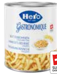
Gelbe Butterbohnen geschnitten