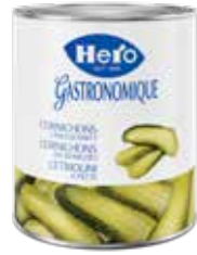
Cornichons Längsschnitt 6 Dosen à 2,85 kg Art.-Nr. 2840.110