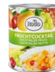
Fruchtcocktail 6 Dosen à 3 kg Art.-Nr. 6241.110