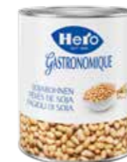
Sojabohnen 3 Dosen à 3,1kg Art.-Nr. 2702.110