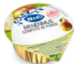
Birnenmus 120 Becher à 100g Art.-Nr. 2352.140