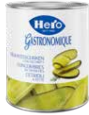
Delikatessgurken Längsschnitt 6 Dosen à 2,85 kg Art.-Nr. 2859.110