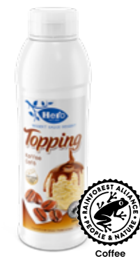
Mocca/Kaffee Flasche à 1kg Art.-Nr. 2417.705