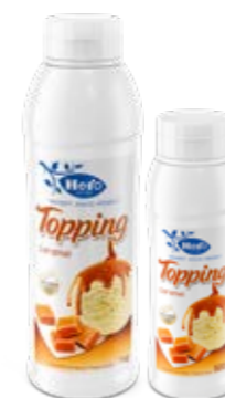
Caramel Flasche à 1kg Art.-Nr. 2414.705 6 Flaschen à 500g Art.-Nr. 2414.700