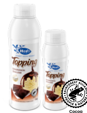
Schokolade Flasche à 1kg Art.-Nr. 2413.705 6 Flaschen à 500g Art.-Nr. 2413.700