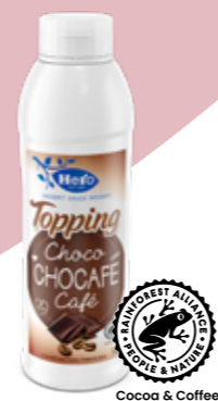
Chocafé Schokolade und Kaffee Flasche à 1kg Art.-Nr. 2422.705

Ein sündiges Dessert, ein himmlischer Shake ... Da fehlt nur noch das perfekte Topping. Die geschmacksintensiven, hochwertigen Hero Toppings dekorieren und aromatisieren Ihr Crème-Dessert, ein feines Stück Torte oder Gebäck und natürlich Ihre Glaces, Coupes oder Milkshakes. Die seidig glatte Konsistenz rundet das Geschmackserlebnis ab.