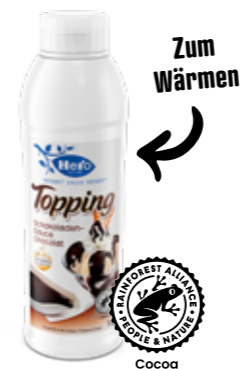
Schokoladensauce Flasche à 1kg Art.-Nr. 2418.705