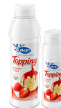
Erdbeer Flasche à 1kg Art.-Nr. 2415.705 6 Flaschen à 500g Art.-Nr. 2415.700